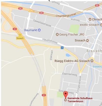
Anfahrtsplan Sek Sissach